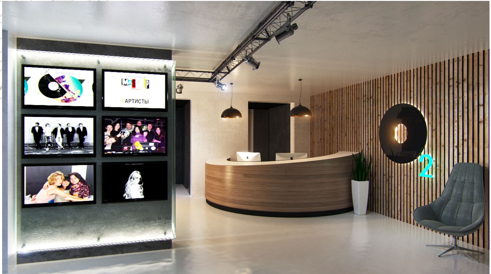
Вариант 2. Светлый и современный