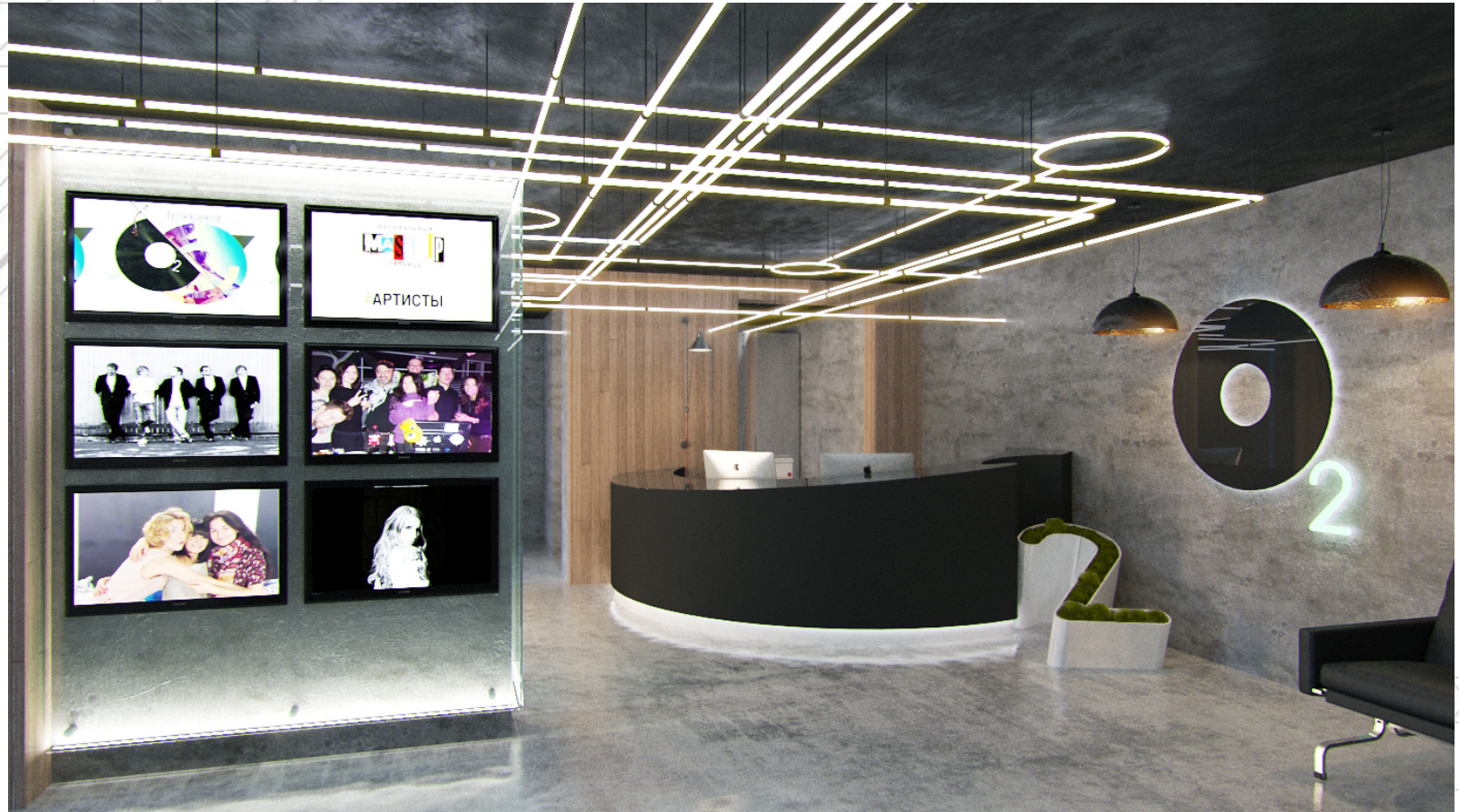
Вариант 1. Темный индустриальный